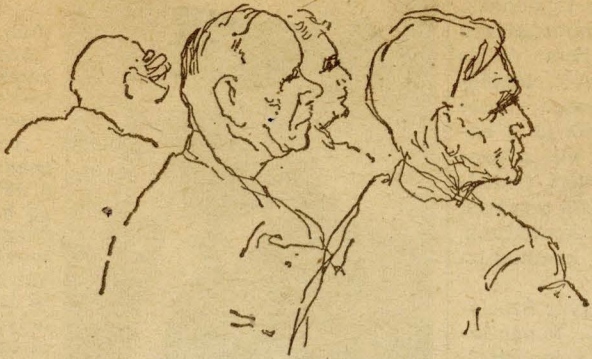
Békés megyei küldöttek