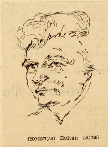
(Rozsnyai Zoltán rajza)