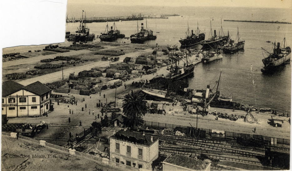
288 — ALGER - Dans le Port