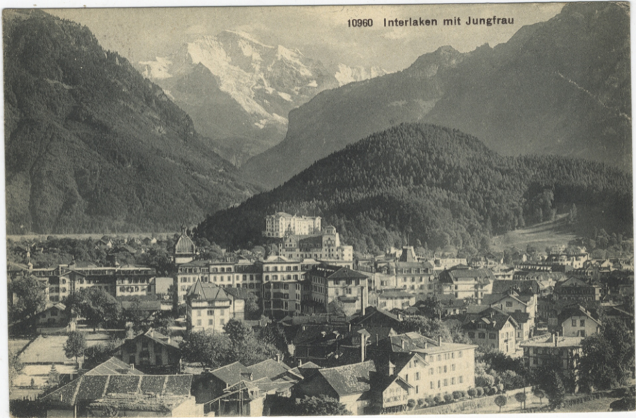
10960 Interlaken mit Jungfrau