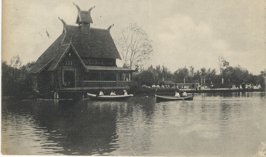
KIEL Schreventeich im Hohenzollernpark