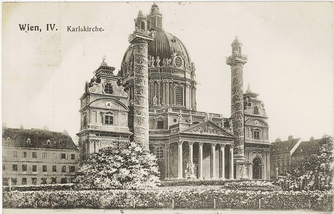
Wien, IV. Karlskirche.