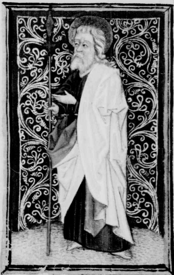
in dubio Thomas q d' didim' ap' Cesarēā i India spartus r medis Euāg' r predicauit. ibi qz sub rege Indofero a pōtifice tēpli vādolū gladio catus est

Quintus ar sus Thome didimi descendit ad inferna Lph e descendit pri mum ad inferiores partes terre Tercia die resurre xit a mortuis Anshelmus des cendit ad inferna anima sola Quare vt electos qui ibi detine bantur iniuste ppter originale peccatū liberaet et ad celos redu ceret Vnde Orce 12 V mors ero mors tua morsus tuus ero inferne momordit dñs infer num qā inde ptem abstulit et partē reliquit Sexta om' scia tua fixus est Obōis quiclut