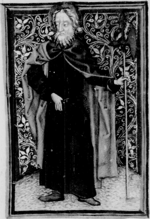
Mathe' publica' Simn' ta q' ap' Iudaeo pia predicat' martiriū pass' est ab Ier. tace: au' iussu iactu gladii a tyro sciens martirē fecit spiculator

Bonus articulus Mathe antam calesiam Anshelmus Italia grece congregatio fide lium latine dicit et hec distat inter congregatoz et conuencioem Vniu conuencio fit de fidelibz Congregatio vero no solum de fidelibz sed etiam de infidelibz et de animalibz et de lapidibz Katholicon grece latine dicit Vniuersalis quia sancta ecclesia p vniu sum orbis dilatata est Augustinus Sacendum est q' ecclesiaz crede non tam in eccle siam crede debem' quia ecclesia