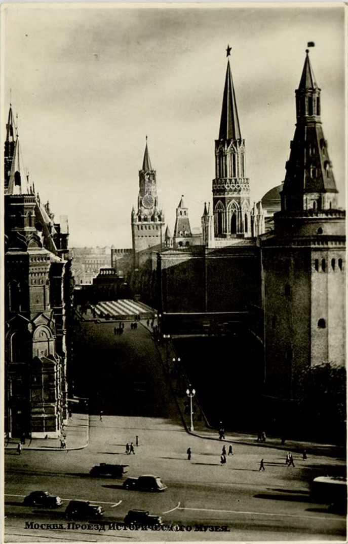
МОСКВА. ПРОЕЗД ИСТОРИЧЕСКОГО МУЗЕЯ.