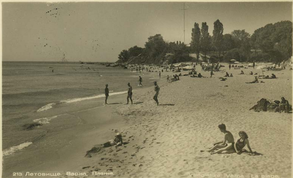
213 Лeтoвищe. Вapнa. Плaнa.