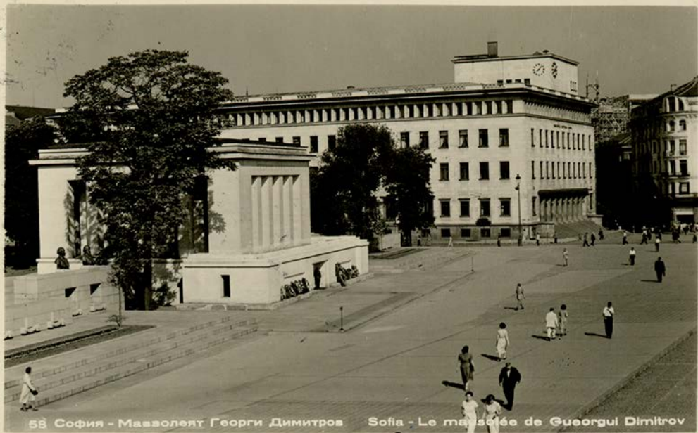
58 София - Мавзолеят Георги Димитров