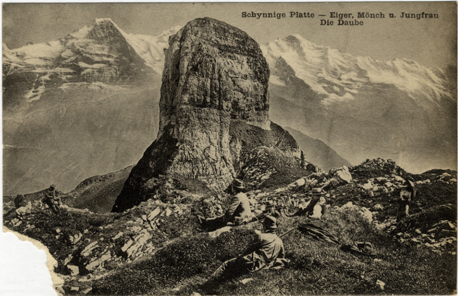
Schynnige Platte — Eiger, Mönch u. Jungfrau Die Daube