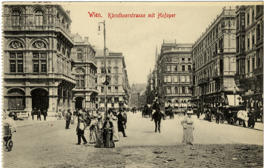
Wien. Kärnthnerstrasse mit Hofoper