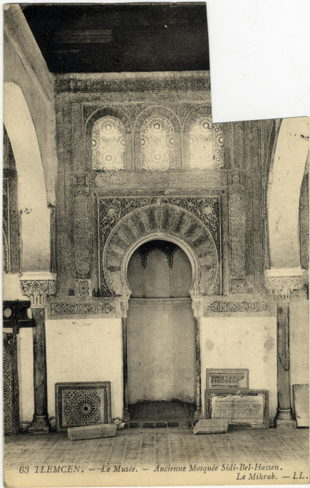
63 TLEMCEN. — Le Musée. — Ancienne Mosquée Sidi-Bel-Hassen. Le Mihrab.