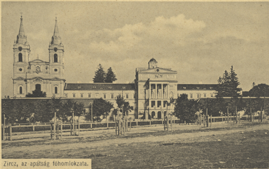
Zircz, az apátság főhomlokzata.